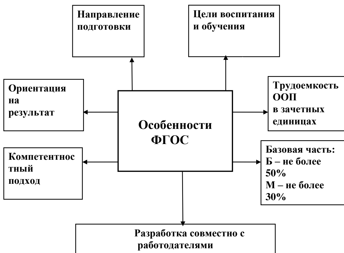
Схема 3. Особенности ФГОСов

Особенности разработки ООП по ФГОсам представлены на схеме 3.