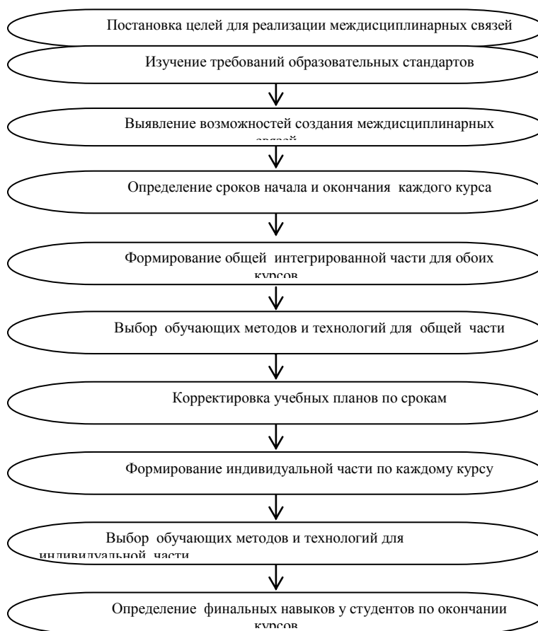
Рисунок 1. Схема процесса формирования междисциплинарных связей между сопряженными курсами

На рисунке 1 представлена схема процесса формирования междисциплинарных связей между сопряженными курсами. В контенте каждой дисциплины выделяется индивидуальная часть (присущая только этой дисциплине), и интегрированная часть, которая является общей для обеих дисциплин. Таким образом, можно выделить несколько этапов процесса создания интегрированной части нескольких курсов, а именно: предварительная подготовка, планирование фонда учебного времени, создание индивидуальной и интегрированной части по каждому курсу, выбор методов оценивания результатов.