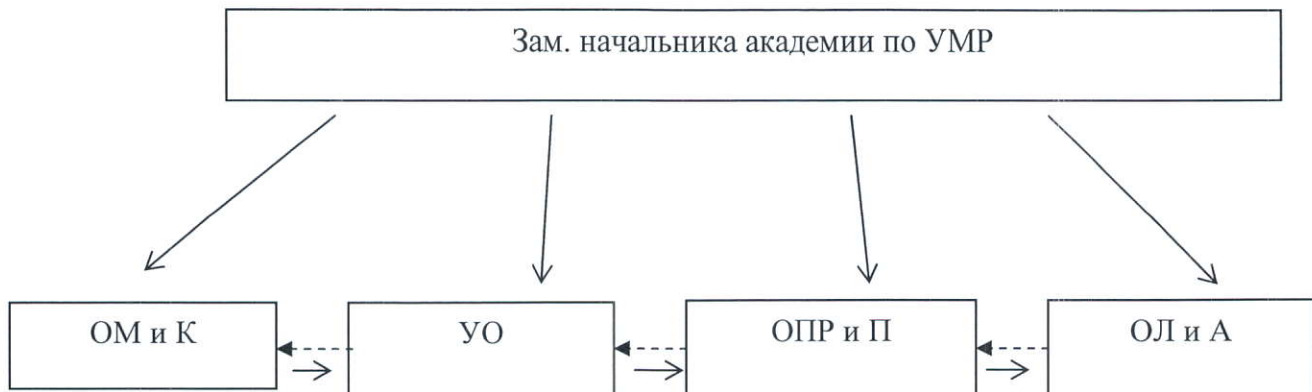
Рис. 2. Взаимоотношения отдела с другими подразделениями