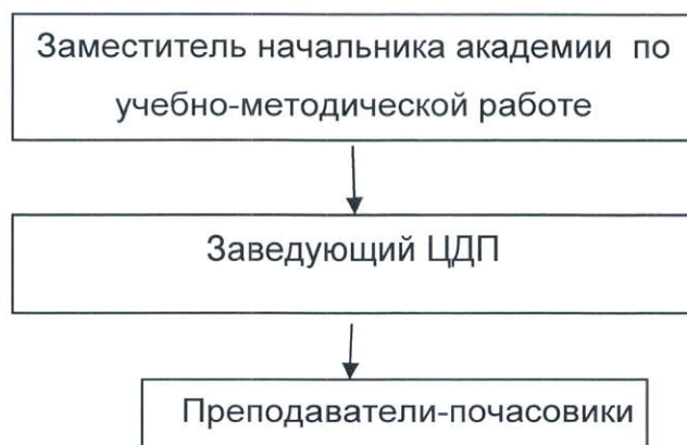
Рис. 1. Структура центра довузовской подготовки