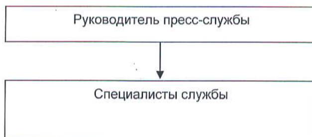
Рис. 1. Структура пресс-службы

Структуру и штат пресс-службы утверждает начальник академии в соответствии со структурой аппарата управления и нормативами численности специалистов и служащих с учетом объемов работы и особенностей академии. Структура пресс-службы представлена на рис.1.