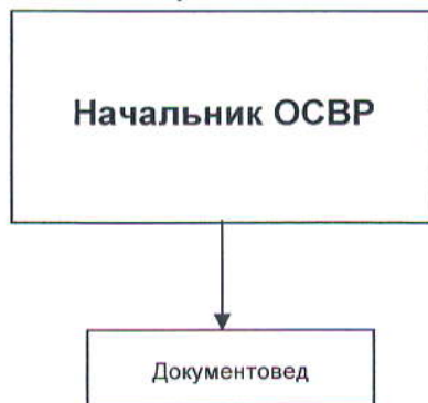
Рис.1 Структура ОСВР