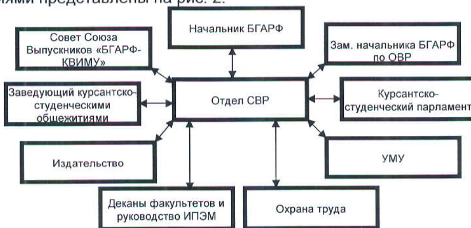
Рис.2 Взаимоотношения с другими подразделениями

Взаимоотношения отдела социально-воспитательной работы с другими подразделениями представлены на рис. 2.